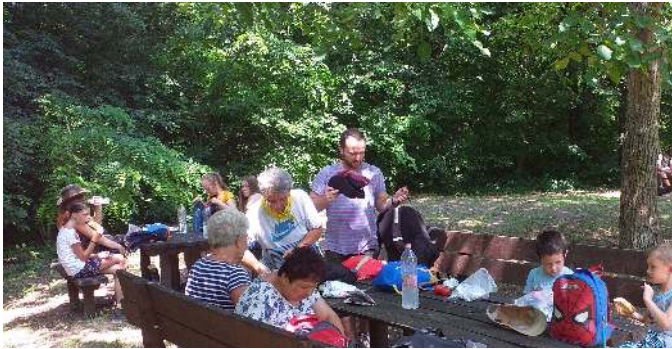
Dömsöd, Természetismereti tábor