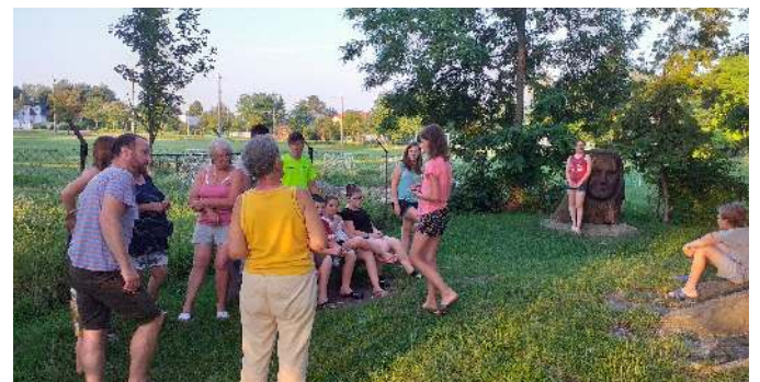
Dömsöd, Természetismereti tábor

A Faluházban rendszeresen működő tanfolyamok, szakkörök, klubok időpontjai megtalálhatók a honlapunkon, és minden negyedév első havi újságjában.