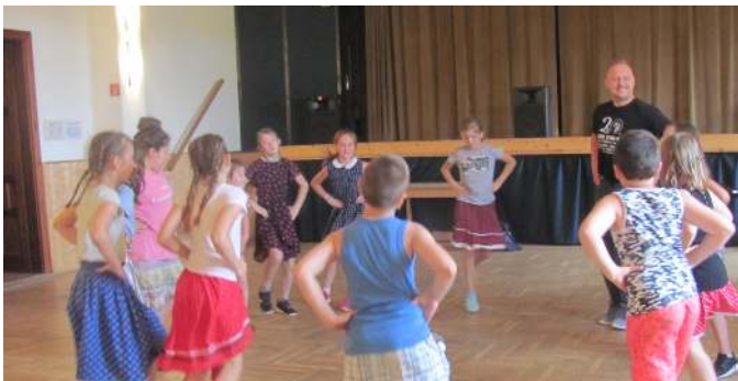
VEKOP Néptánc Tábor