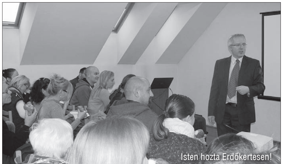
Isten hozta Erdőkertesén!