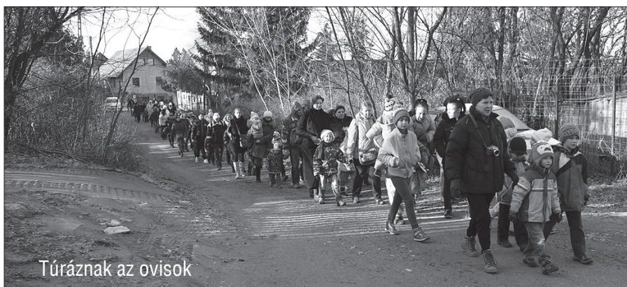
Túrának az ovások